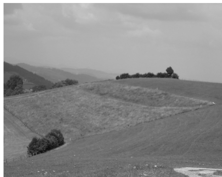
Magerwiese an Südhang

Weitere ökologische Ausgleichsflächen sind extensiv genutzte Weiden, Wassergräben, Ruderalflächen oder Steinhäufen und einheimische, standortgerechte Einzelbäume oder Alleen. Auch diese wertvollen Objekte werden bei der landwirtschaftlichen Nutzung angerechnet, eine Ausgleichsentschädigung hingegen wird nicht geleistet. Alle Massnahmen zur ökologischen Aufwertung unserer Landschaft dienen seltenen Pflanzen und Tieren und verbessern deren Lebensraum. Bedrohte Orchideen, seltene Vögel oder Schmetterlinge können so vor dem Verschwinden gerettet werden.