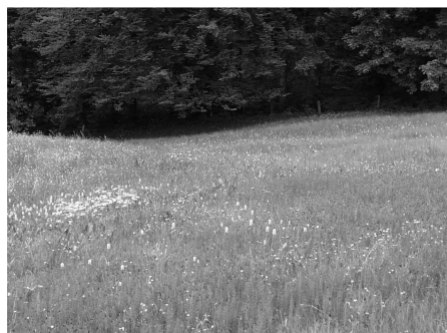
Flachmoor mit Wollgräsern