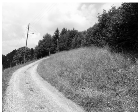
Hecke mit Krautstreifen