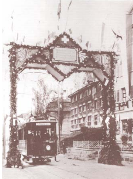
Eröffnungsfahrt am 20. Mai 1897

So erhielt das Initiativkomitee am 08. November 1894 vom Gemeinderat der Stadt St.Gallen die Konzession für den Bau und Betrieb einer Strassenbahn. Die Bürgerversammlung der Stadt St.Gallen beschloss am 10. November 1895 den Bau einer Trambahn mit vorerst zwei Linien: Stocken – Heiligkreuz und Bahnhof – Krontal. Der Betrieb sollte durch die Stadt St.Gallen „auf eigene Rechnung und Gefahr“ geführt werden. So wurde auf diesen Linien am 20. Mai 1897 der fahrplanmässige Betrieb aufge-