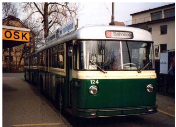
Trolleybus Linie 3, ca 1980

In den folgenden Jahren veränderte sich das Mobilitätsverhalten derart, dass jedes Jahr mehrprozentige Frequenzzunahmen auf den Buskursen zu verzeichnen waren und aber auch der motorisierte Individual-