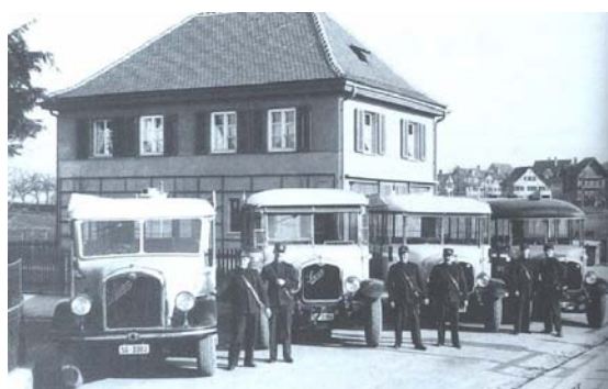
Autobusflotte Firma Halter, ca 1930

Später erfolgte eine Netzerweiterung nach der Oberstrasse, welche mit einer Ausdehnung durch die Überlandstrecke nach Abtwil verbunden wurde.