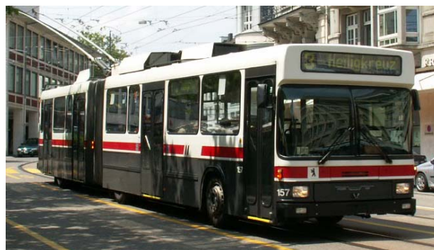
Gelenktrolleybus Hess/NAW, ab 1991

Mitte der Achtziger-Jahre stieg das Passagiervolumen nochmals an auf über 24 Mio Passagiere. Wesentlich dazu beigetragen hatte die Einführung eines Abonnement-Verbundes, welcher 1982 als Versuch und ab 1985 definitiv eingeführt wird. Mit diesen Monats- oder Jahresabonnements konnte innerhalb des erweiterten Stadtgebietes jedes öffentliche Transportmittel benutzt werden. Das Abonnement „Stadt-Spass“ war ab 1987 der Inbegriff für die einfache Benützung des öffentlichen Verkehrs in St.Gallen. Die Geschäftsführung des Aboverbundes lag bei den VBSG. Auf 2002 trat der Tarifverbund OSTWIND in Kraft, welcher das bisherige Verbundsystem auf die Kantone St.Gallen, beide Appenzell und Thurgau ausdehnt.