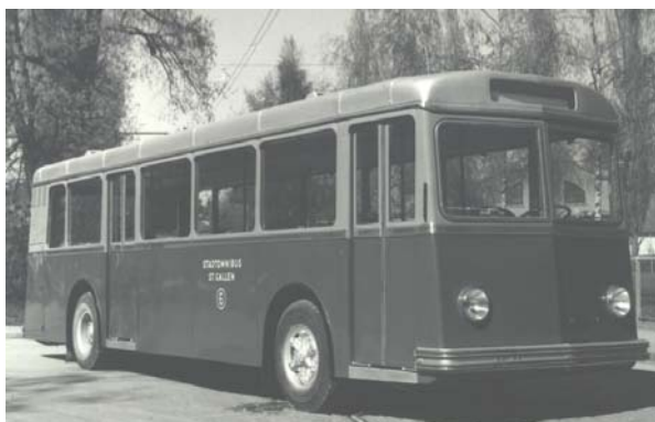
Stadtomnibus Nr. 6 St.Gallen, 1948

erhalten, wurden drei der fünf Omnibusse auf Ersatztreibstoffe (Holzgas) umgebaut. Nach Ansicht des Stadtrates kam der Umbau der zwei ältesten Wagen aufgrund ihres Alters und ihres geringen Fassungsvermögens nicht in Frage. Die Anschaffung neuer Holzgas-Omnibusse konnte noch weniger verantwortet werden. So trat die Frage nach der Einführung des ersten Trolleybusses schneller in den Vordergrund als ursprünglich beabsichtigt.