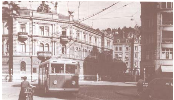
Trolleybus der Linie 5 beim Helvetiaplatz, 1950

Der Trolleybusbetrieb konnte dann am 18. Juli 1950 auf der Teufenerstrasse (Linie Riethüsli) und am 15. November 1950 auf der Heiligkreuzlinie aufgenommen werden. Das Tram verkehrte nun nur noch auf der Strecke Stocken – Bahnhof – Neudorf. Da die städtischen Verkehrsbetriebe daraufhin drei verschiedene Transportarten umfassten (Tram, Trolley- und Autobus), wurde die bisherige Bezeichnung „Trambahn der Stadt St.Gallen“ vom Stadtrat in „Verkehrsbetriebe der Stadt St.Gallen“ abgeändert.