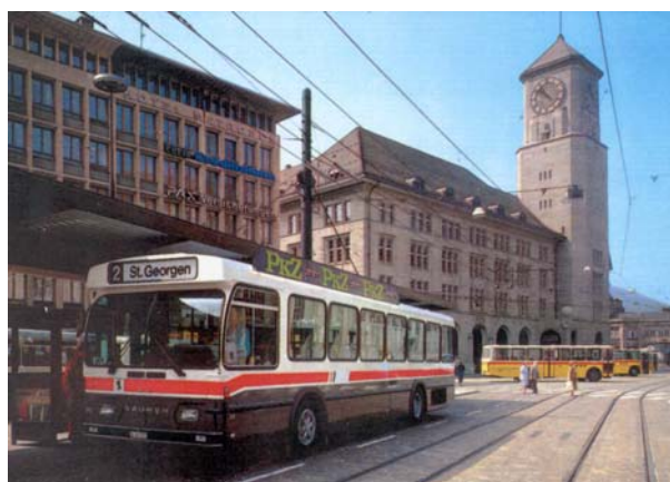
Autobus im neuen Design, ab 1983

Nach dem Abbruch des alten Rathauses konnten im Jahre 1978 auf dem Bahnhofplatz die an verschiedenen Ecken gelegenen Abfahrtsorte der VBSG-Busse im neuen Bushof zentralisiert werden. Gleichzeitig öffnete der Verkaufs- und Informationspavillon seine Türen für die Kundschaft.