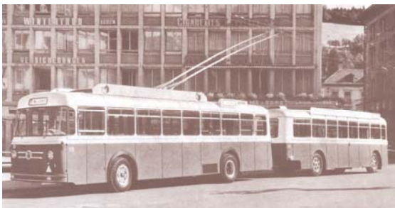
Trolleybus mit Anhänger, ab 1957

Inzwischen wurden im Bau von Tramwagen grosse Fortschritte erzielt. In der Schweiz hatte sich in Zusammenarbeit verschiedener Strassenbahn-Gesellschaften der schweizerische Tram-Standard-Wagen entwickelt, der in Zürich, Basel, Bern, Luzern und Genf bereits im Einsatz stand und sich bewährt hatte. Auch der Trolleybus war aber inzwischen verbessert worden. So fielen z.B. die Versuche mit Trolleybusanhängern auf der Linie Heiligkreuz positiv aus. Dies eröffnete die Möglichkeit, den teuren Betrieb mit Einzelwagen rationeller zu gestalten. Die beiden Varianten hielten sich demnach sowohl betrieblich als auch finanziell die Waage, und so fiel es den Behörden nicht leicht, eine Entscheidung zu treffen. Erst nach längerer Debatte nahm der Gemeinderat in der Sitzung vom 07. Juni 1955 die Trolleybusvorlage an. Dabei gab die Strassenkostenrechnung, die zugunsten des Trolleybusbetriebes um fünf Millionen Franken niedriger ausfiel, den Ausschlag. In der Abstimmung vom 10. Juli 1955 wurde das Projekt von der Bürgerschaft mit 8'565 Ja gegen 5'108 Nein genehmigt.