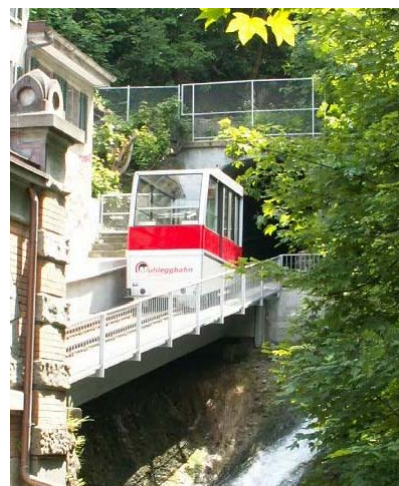
Neue Bahn von 2004

In der Talstation wurde anschliessend das Wasser in die Steinach abgeleert und das andere sich nun oben befindliche Bähnchen mit Wasserballast versehen. Das Wasser stammte aus dem Brand- und Bädlibach, da der Mühleggweiher bereits für die Dampflokotiven der VSB angezapft wurde. Diese Antriebsart funktionierte bis 1950, anschliessend verkehrte bis zum Jahr 1975 eine Zahnradbahn, welche wiederum durch den im Jahre 2004 vollständig erneuerten Schräglift ersetzt wurde. Somit ist die Mühleggbahn das älteste innerstädtische Nahverkehrsmittel, die Geschäftsführung liegt seit 1953 bei den VBSG.