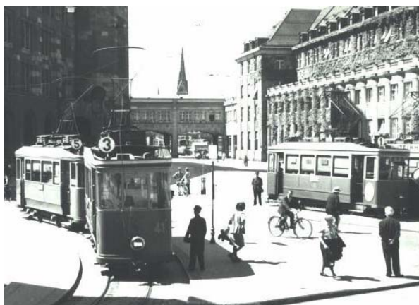
Trambahn am Bahnhofplatz, 1943

Die Trambahnverwaltung erarbeitete deshalb 1919 im Auftrag des Stadtrates ein entsprechendes Projekt. Die Realisierung desselben wie auch einer überarbeiteten Fassung aus dem Jahre 1923 wäre jedoch für die Stadtkasse zusätzlich zur defizitären Nestlinie eine zu starke finanzielle Belastung gewesen. Daraufhin regte der Quartierverein eine Autobusverbindung an. Da auch diese Untersuchungen einen jährlichen Ausgabenüberschuss ergaben, wies der Stadtrat ein Gesuch des Vereins nach einer Fahrverbindung nach Rotmonten am 22. Januar 1924 zurück.