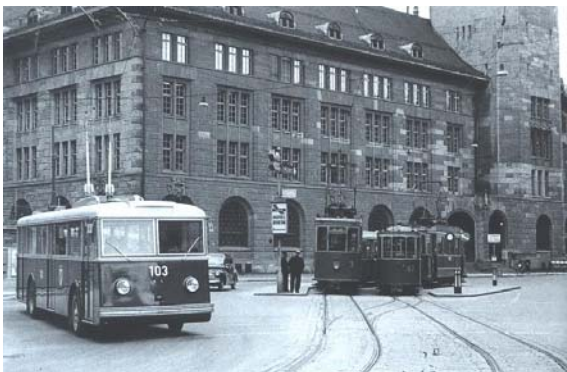
Trolleybus und Trambahn am Bahnhof, 1950

Nach einem Beschluss des Gemeinderates vom 10. Mai 1946 wurde der von Paul Halter geführte Stadtomnibusbetrieb per 1947 durch die Stadt übernommen und in Verbindung mit der Trambahn weitergeführt. Die Strecken, der Fahrplan und die Tarife wurden beibehalten, die Wagen jedoch fortan nicht mehr in den drei gemieteten Garagen, sondern im alten Trambahndepot untergebracht. Dies erleichterte zwar den Unterhalt, brachte aber noch keine Verbesserungen für die Fahrgäste, denn die Wagen waren vor allem während den Stosszeiten nach wie vor überfüllt. Deshalb wurde zur Ergänzung und Erneuerung des Wagenbestandes im Mai 1947 und im Juli 1948 je ein neuer, grosser Autobus in Auftrag gegeben, deren Lieferung im Jahre 1948 erfolgen sollte. Bis dahin wurde zur Bewältigung der beständig zunehmenden Stossfrequenzen Leihwagen der Post und schliesslich auch zwei private Zusatzwagen für Mittagskurse eingesetzt. Auch der Personalbestand wurde von 7 auf 9 Mann erhöht. So konnte der Fahrplan merklich verdichtet werden.