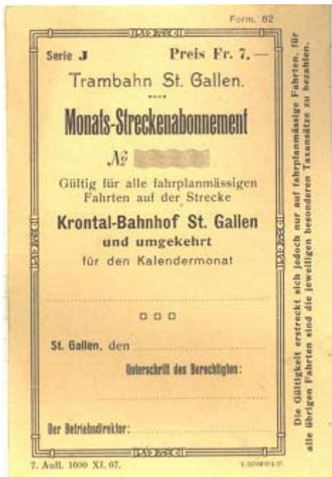
Streckenabonnement vor 100 Jahren

re Auswahl an Strecken-, Arbeiter- oder Schüler-Abonnements.