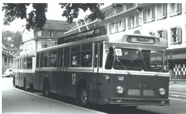
Trolleybus mit Anhänger, ab 1968

Mit der in den Jahren 1967 - 69 folgenden Fahrzeugerneuerung mit insgesamt 18 Trolleybussen wurden erstmals einige Trolleybusse beschafft, die eine stufenlose elektronische Steuerung für Gleichstromfahrzeuge aufwiesen (Chopper-Steuerung). Ebenso konnte die Autobus-Flotte mit 21 neuen Saurer-Autobussen erneuert werden.