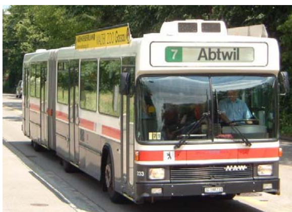
Linie 7 in voller Fahrt

der Straffung von Arbeitsabläufen, Optimierung von Fahrplan und Personaleinsätzen gelang es in den darauffolgenden Jahren, die Kosten für die Besteller (Bund, Kanton und Stadt) laufend zu senken und das Angebot zu halten. Kleinere Angebotsausbauten erfolgten in den letzten Jahren auf den Linien Bahnhof – Mörschwil, Führung der Abendkurse St.Gallen – Horn, bei einzelnen Nachtkursen und mit der Verlängerung der Linie 1 von Winkeln nach Oberwinkeln. Kürzlich sind Angebotserweiterungen vom Riethüsli nach Oberhofstetten (Versuchsbetrieb) und die Schliessung von Taktlücken auf der Linie nach Mörschwil erfolgt.