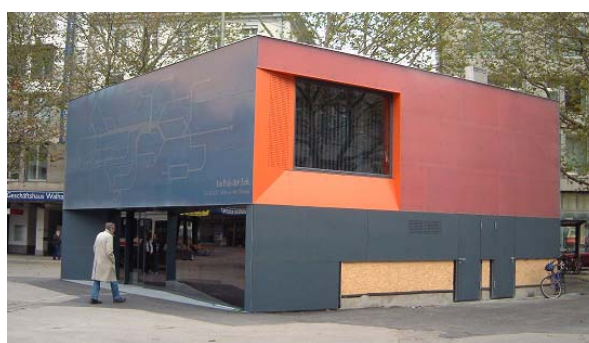
Neuer Pavillon am Bahnhofplatz

Personalwechsel unter Tags finden in der Regel am Bahnhofplatz statt. Dazu konnte im Jahre 2004 ein neues, 2-stöckiges Gebäude aus Fertigelementen eingeweiht werden. Im oberen Stock befinden sich neuzeitliche Personalräume, die auch dem Fahrpersonal von PostAuto und Regiobus zur Verfügung stehen. Im Parterre befinden sich die Schalter der VBSG für Billettverkauf und Informationen.