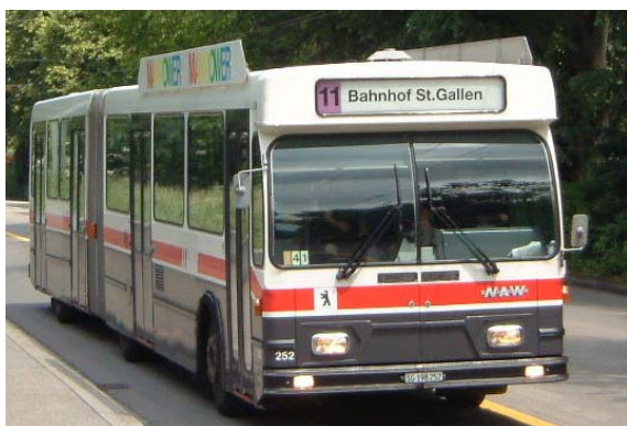
Gelenkautobus NAW, ab 1988

Nachdem nun jahrelang die grün-weissen zweiachsigen Trolley- und Autobusse mit den Anhängewagen den Verkehr bewältigt hatten, wurden im Jahre 1980 vier Steyr-Citybusse für den Einsatz in den Randstunden angeschafft. Die Erneuerung der ältesten Auto- und Trolleybusse erfolgte 1983/84, als zwölf zweiachsige Saurer-Dieselbusse und 11 dreiachsige Gelenk-Trolleybusse in den städtischen Farben anthrazit/rot/weiss in Betrieb genommen wurden.