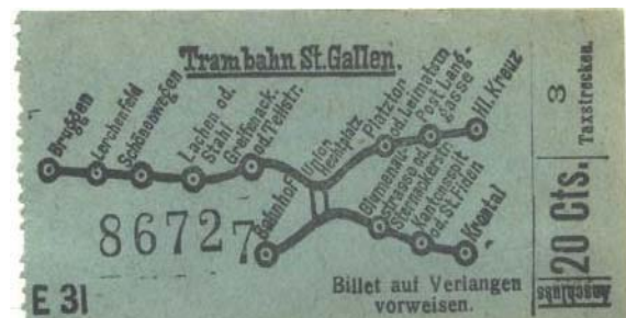
Einzelbillett von 1897

Im Tarif für die Trambahn St.Gallen aus dem Jahre 1897 war vorgesehen, dass die Taxe für eine einfache Fahrt, welche eine eingeschränkte Taxstrecke nicht überstieg (zB Bahnhof – Blumenau oder Bahnhof - Bürgerheim), 10 Rappen betrug. Jede weitere Taxstrecke kostete zusätzliche 5 Rappen, bis zum Maximalbetrag von 30 Rappen für eine Einzelfahrt über das ganze Netz. Kinder unter vier Jahren in Begleitung wurden gratis befördert, ansonsten war keine Kinderermässigung vorgesehen.