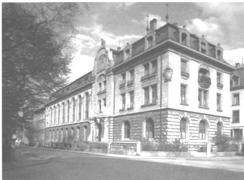
Kantonbibliothek (Vadiana), Notkerstrasse 22, 9000 St.Gallen. Aufnahme 1948