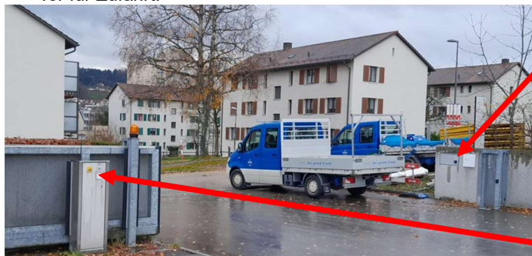
Tor mit Batch öffnen (3)