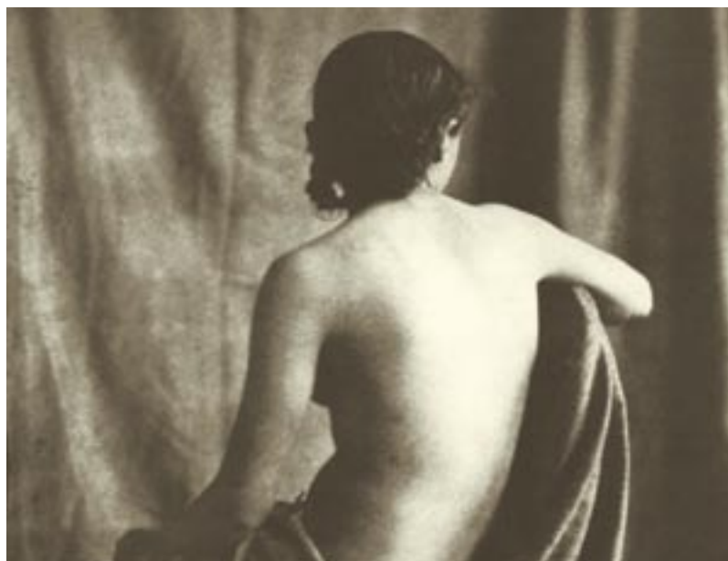
Eugène Durieu (1800–1874): Akt (Ausschnitt), um 1853, Salzpapierkopie

www.stopp-kinderpornografie.ch (webcode 2204d)