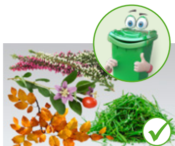
Baštenski otpad, pokošena trava, lišće, šiblje