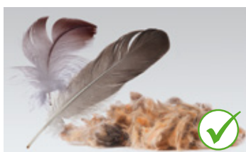
Perje i kosa