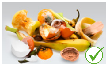
Kore, ljuske jaja, otpad od voća i povrća