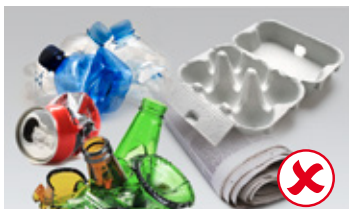
PET, aluminijum, staklo, stari papir, karton, tekstil