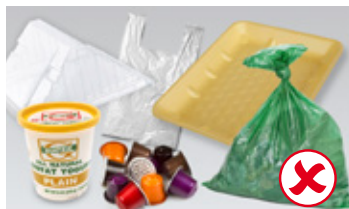
Plastične kese, pakovanja od namirnica, kapsule od kafe