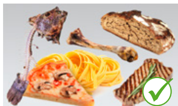
Ostaci hrane kao što su meso, riba, sir, hleb i peciva