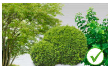
Otpad od rezanja drveća i grmova (maks. dužina 90 cm, Ø 7 cm)