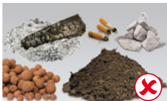
Zemlja, pepeo, kamenje, opušci od cigareta