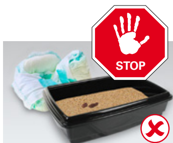
Pelene, pesak za mačke, životinjski izmet