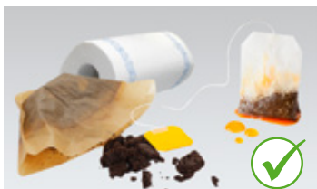
Talog od kafe i čaja, filter papir i kuhinjski papir