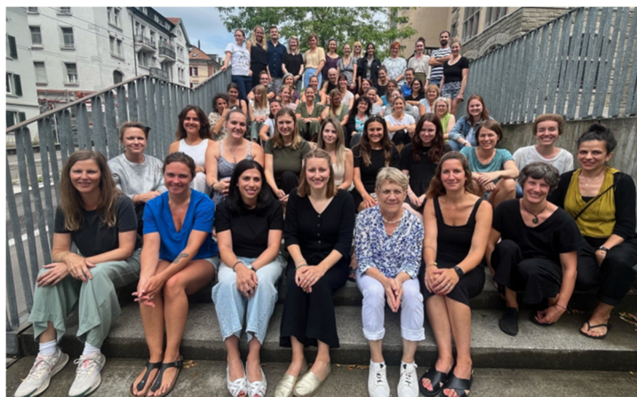
Das Schönenwegenteam 2024-2025